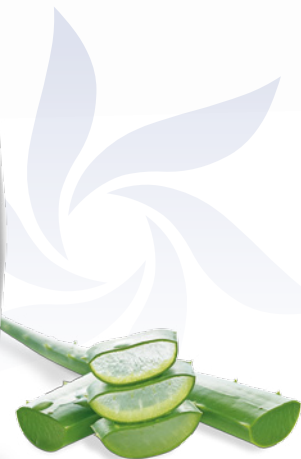
Fit-aroma®: Aloe vera

Il Fit-aroma® di MONGE VETSOLUTION FELINE DERMATOSIS contiene Aloe vera. È scientificamente provato che l'estratto di Aloe vera abbia proprietà rigenerative del collagene e migliori l'elasticità della pelle e del derma.